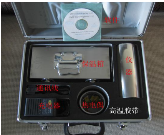
La foto deCOLO- SMT-7